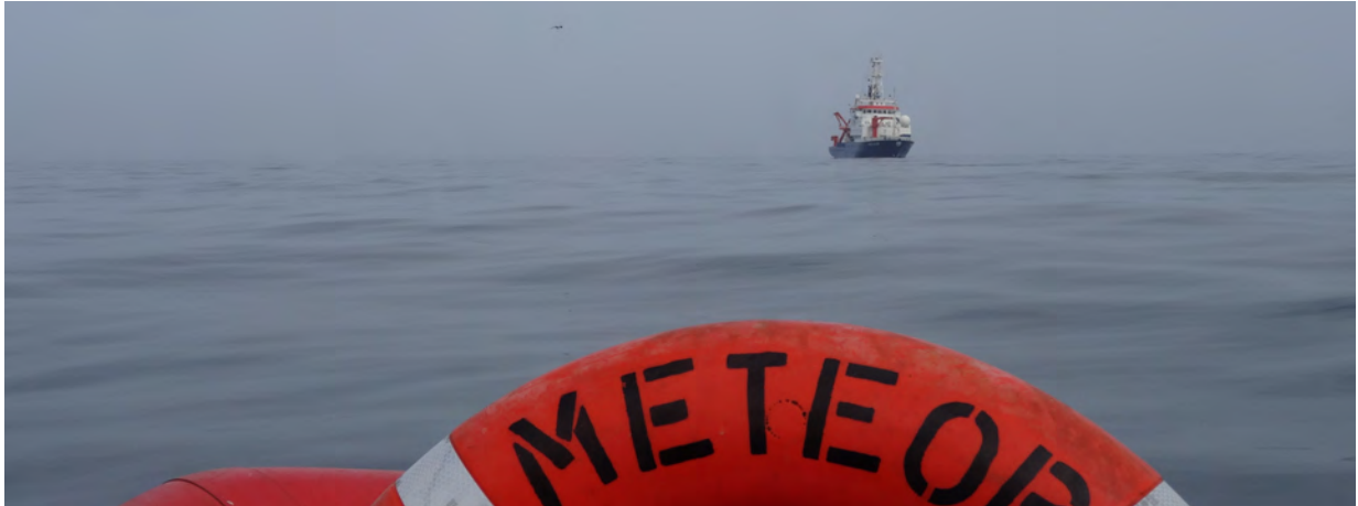
FS Meteor vom Schlauchboot aus bei Arbeiten vor der Banc d'Arguin.

In der zweiten Woche der Reise M129 mit FS Meteor konnten wir das Stationsnetz vor Mauretanien erfolgreich bearbeiten, so dass wir wie geplant am Montag, den 15. August morgens die mauretanischen Gewässer verlassen können und Richtung Senegal aufbrechen.